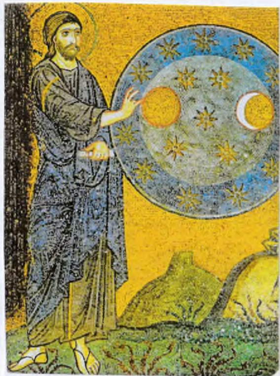
Сотворение светил. Музей Эрмитажа. Паладинская капелла Палермо. Сикстинская.

" Господь премудростию основал землю, небеса утвердил разумом;" (Притч. 3.19)