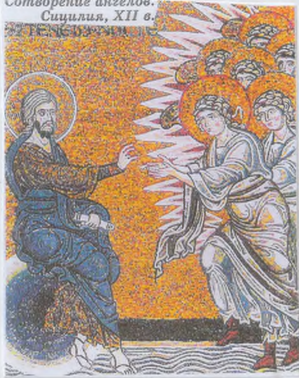
Сотворение ангелов. Сицилия, XII в.

Васильий Великий в первой беседе на шестозвон о начале мира вышних дров рассуждает так: „было вероятно, и прежде сего мира, что второе, хотя может быть