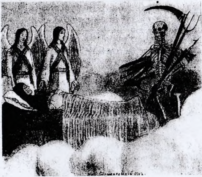
Смерть приходит разрешить душу отъ тѣла. Къ стр. 37.

Помятуй о смерти и не возносись, ибо еще не много, и сведеи будешь во гроб, какую пользу принесут тебе злые де- ла? (Грк. Ефрем Сирий)