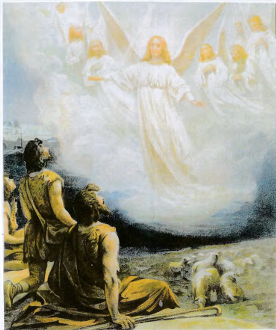
Явление Ангела пастухам.

"И когда неевотное возда- ют славу и честь и благода-