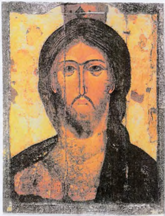
Господь Иисус Христос.

„Не поклоняйся ил и не служи ил, ибо я Господь, Бог твой, Бог ревнитель, наказывающий детей за вину отцов до третьего и четвертого рода, ненавидящего ил. (Исх. 20. 5).“