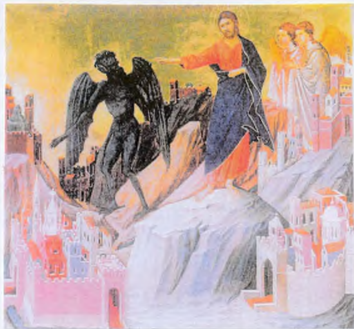
«Всё это дам Тебе, если, пав, поклонимся» Италия

Лукавый человек, во-первых, обманывает собственную душу, лукавство его обращается на главу его, как написано в евангелии: „злоба его обратится на его голову, и злодейство его упадет на его тело“ (Ис. 57, 17) Не своди знаменства с чело