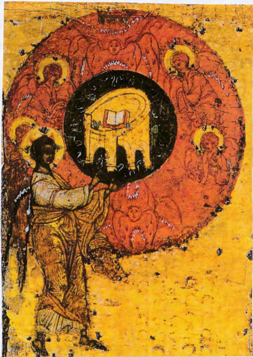
Сотворение Богом мира.

Выййшая к приобретению Божней милости есть смиренность и покорность (Злат.) (Жоук. пс. а 40'ф)