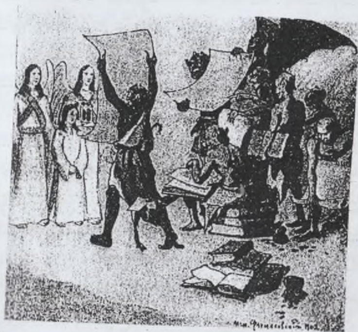
Мытарство неправды и взяточничества.