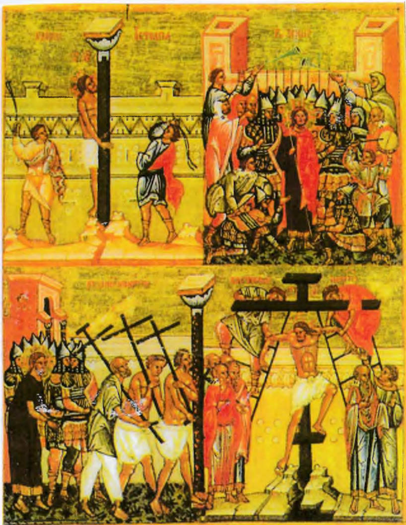
Бичевание Христа. Взятие под стражу. Несение Креста. Воздвижение. Конец XV в. из юрала Софии в Новгороде.

"Духа Божия (и духа заблудившего) узнавайте так: всякий дух, который не