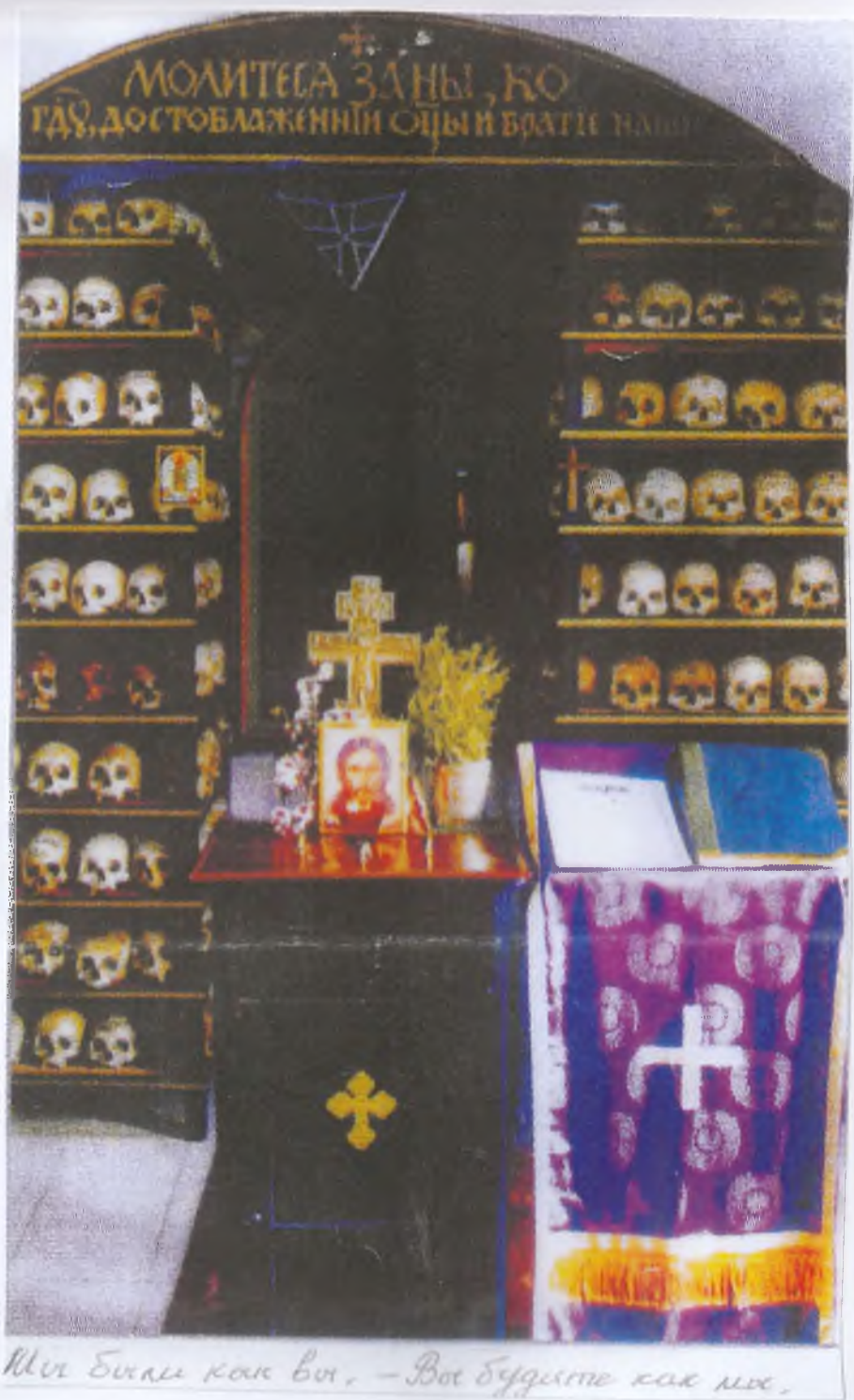
Мы были как вы, - Вы будете как мы.