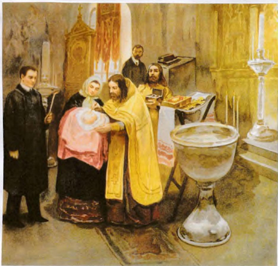
Помазание Святым Миром принявшего Крещение

„Иисус сказал ему в от- вет; истинно, истинно го- ворю тебе, если кто не ро- дится свыше, не может увидеть Царствия Божия.“ (Ив. 3.3)