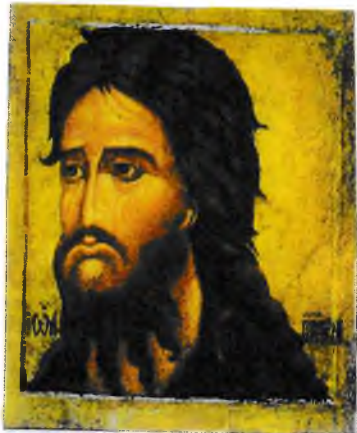
Иоанн Предтеча из деисного чина XVI в

ведует в пустыне Иудейской и гово- рит: покайтесь , ибо приблизилось Царство Небесное. (Мф. 3, 1, 2)