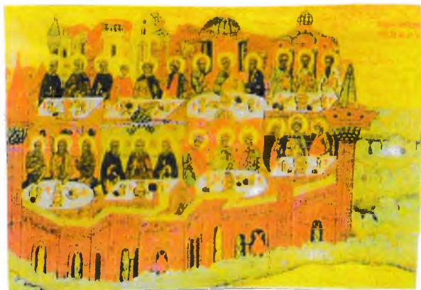
Торжество праведных в Небесном Иерусалиме. Икона «Страшный Суд» из Благовещенского собора Сольвычегодска. 2-я пол. XVI в. (СИХМ). Фрагмент

му Его: приидите, благословенные Отца Моего, наследуйте Царства, уготованное вам от создания мира!" (Мф. 25. 34)