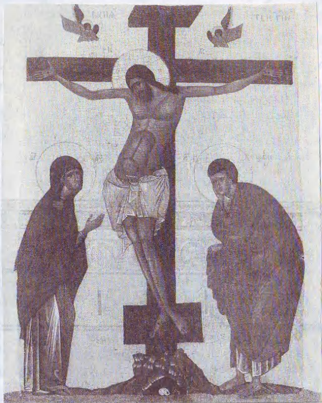
Крест – орудие победы Христовой над грехом и смертью

и не в тысячу лет и не во век, а не в тысячу лет -от людей!