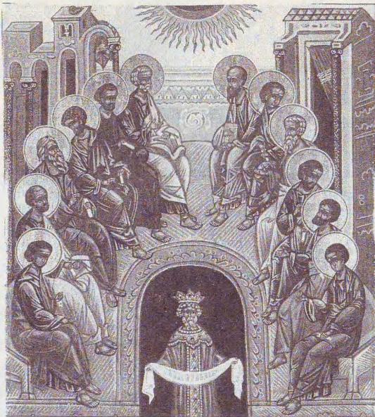
Сошествие Святого Духа на Апостолов