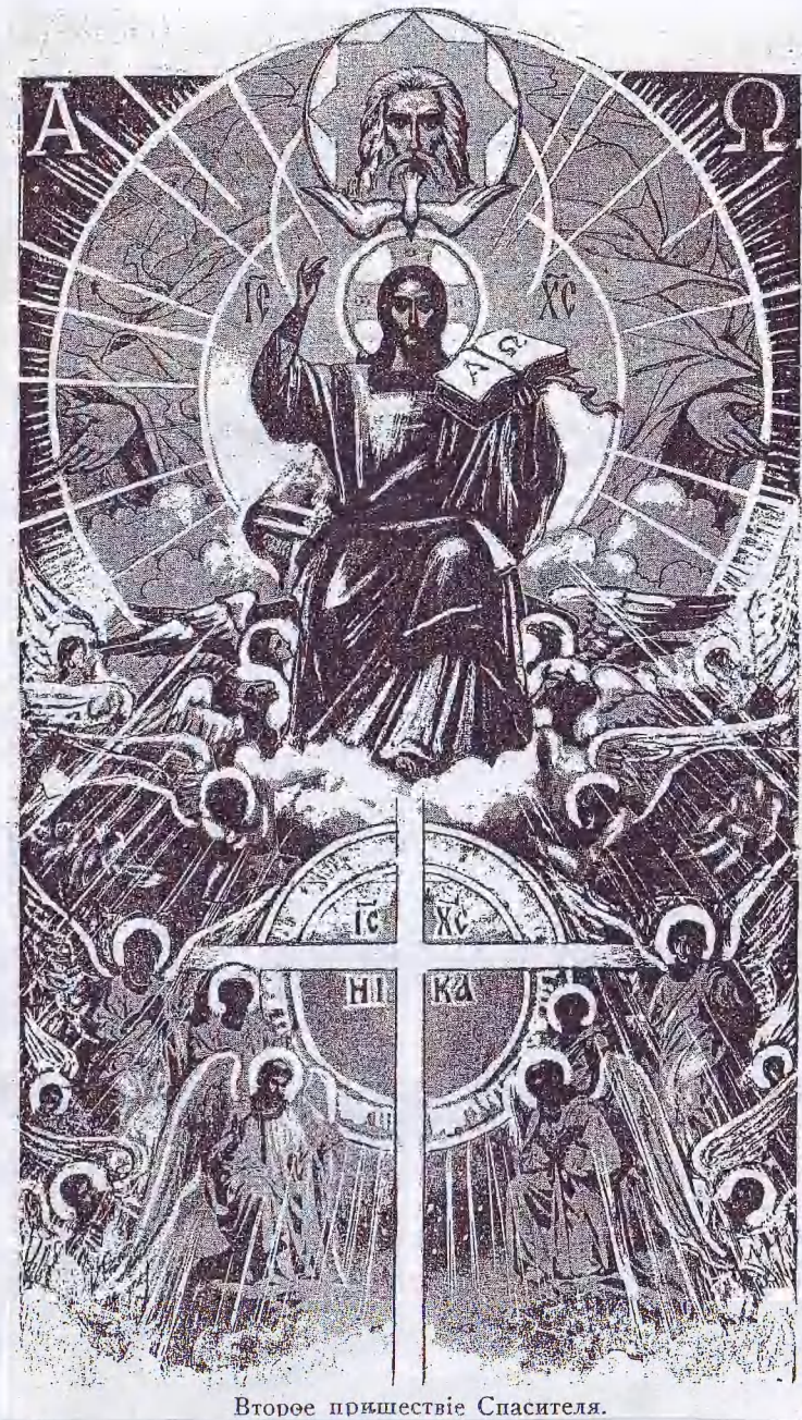
Второе пришествіе Спасителя.