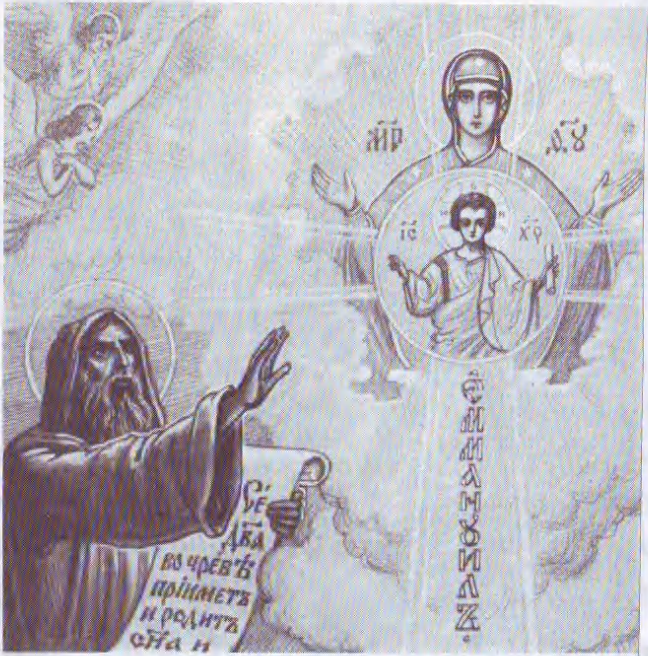
Пророчество Исаии о рождении Спасителя от Девы

... когда Он говорил это, замечает он, то многие уверовали; говорил это, то есть