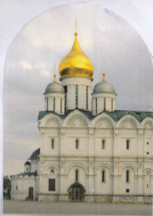
Архангельский Собор Московского Кремля.