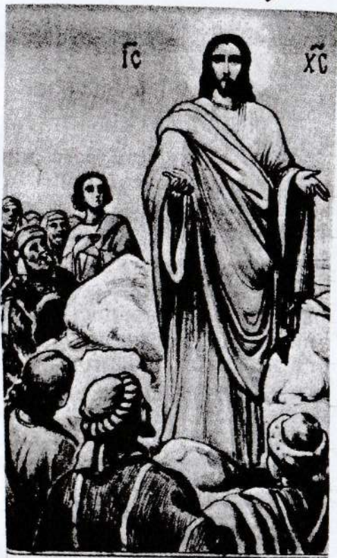
Иисус Христос учит народъ.

и здешние блага, то мы не ус- тупили никакими затрудне- ниями, напротив мужествен- но перенося все, будем благод- арны за все, чтобы ни случи- лось с нами, если будем бо- гаты в познании Иисусовых,