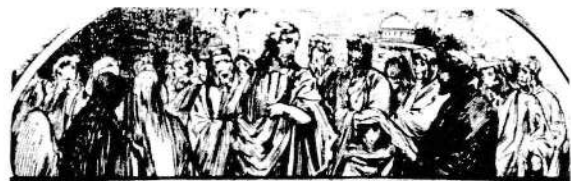
Иисус Христос с Апостолами.

Ты знаешь глаголы вечной жизни." (Ин. 6. 68)