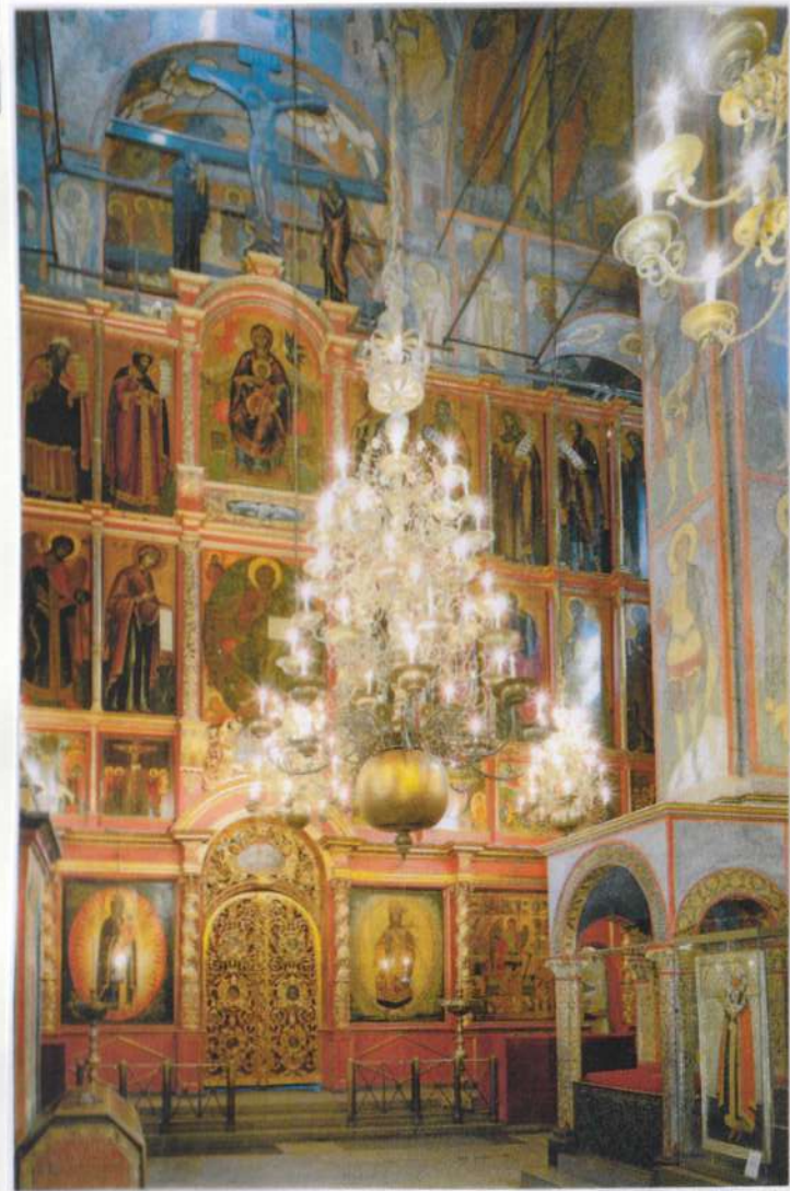
Архангельский собор Московского Кремля: