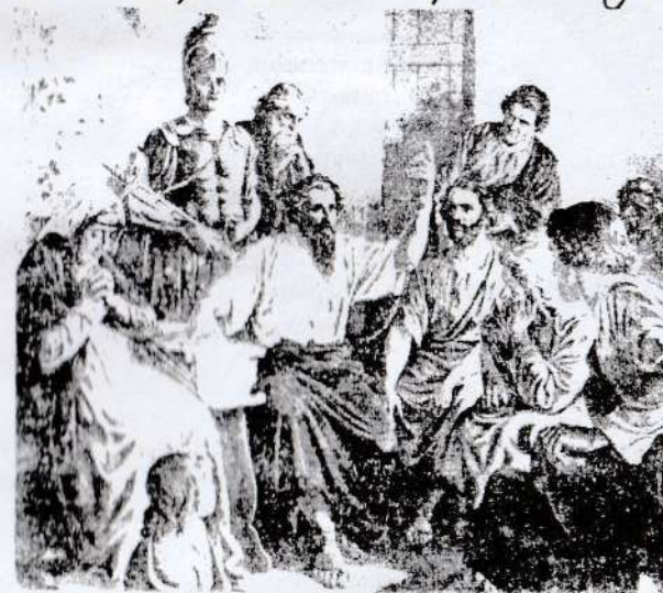
Проповѣдь Ап. Павла въ Римѣ.

„Напоминая вам, братие, Евангелие, которое я благо- вествовал вам, которое вы и принимали, в котором и ут- вердились, которым и кня- суетесь, если приподанное