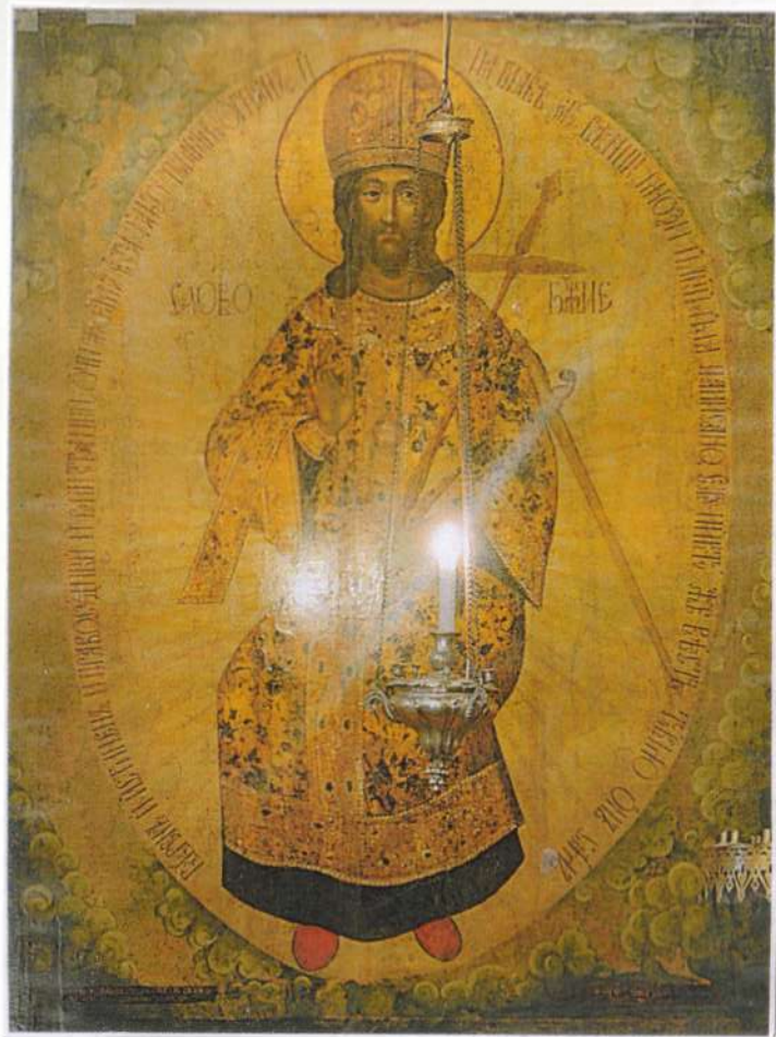
икона „Слово Божие“