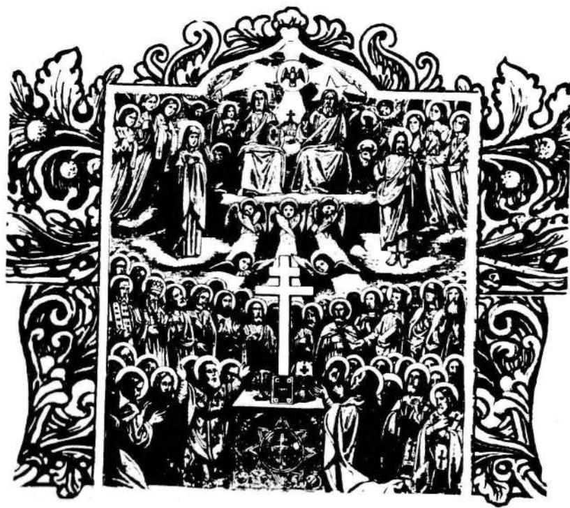
9. (Вѣрую) Во едину святую, соборную и апостольскую Цер- ковь.

Церковь и предал себя за нее, чтобы осветить ее, очистив баню водою посредством слова.“ (Еф. 5. 25, 26)