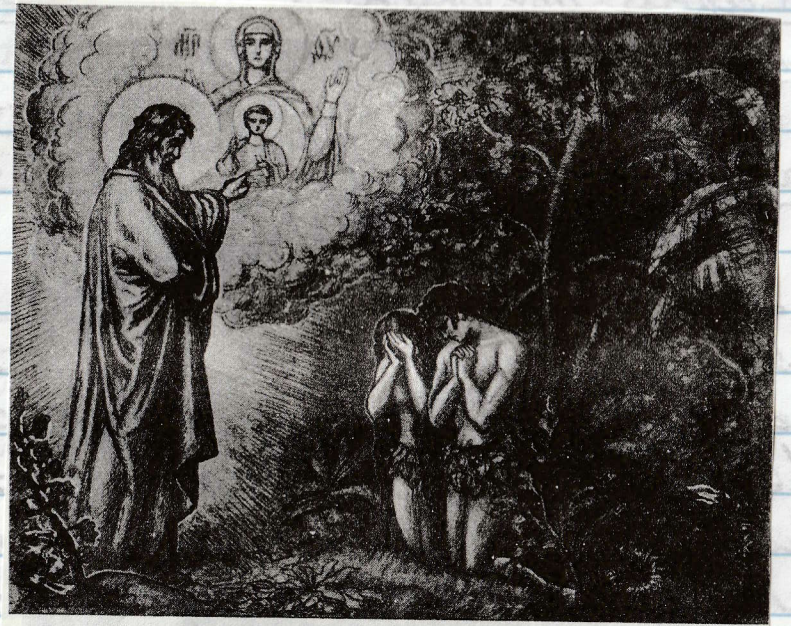
Наказание за грехъ и обѣтование Божіе о пришествіи Спасителя

"Аду же сказал: за то, что ты послушала голоса жены твоей и ела от дерева, о котором Я заповедал тебе, сказав: не ешь от него, проклята земля за тебя; со скорбью будешь питаться от нее во все дни жи-