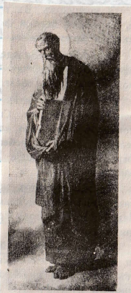
Св. Первоверховный Ап. Павел (Савль)

не отходить от Крита, чем и избежали бы сие затруднений и вреда. Теперь же убеждаю вас ободриться, потому что ни одна душа из нас не погибнет, а только корабль. Ибо Ангел Бога, Которому принадлежу я и Которому служу, явился мне в эту ночь и сказал: "не бойся, Павел! тебе должно предстать пред кесаря, и вот, Бог даровал тебе всех плывущих с тобою." (Деян. 27, 21-24) "Поэтому прошу вас принимать пищу; это послужит к сохранению вашей жизни; ибо ни у кого из вас не пропадет волос с головы. Сказав это и взяв