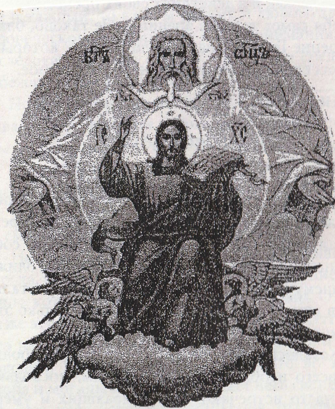
Господь Бог, Отец, Сын и Святой Дух, Троица Единосущная и Нераздельная.