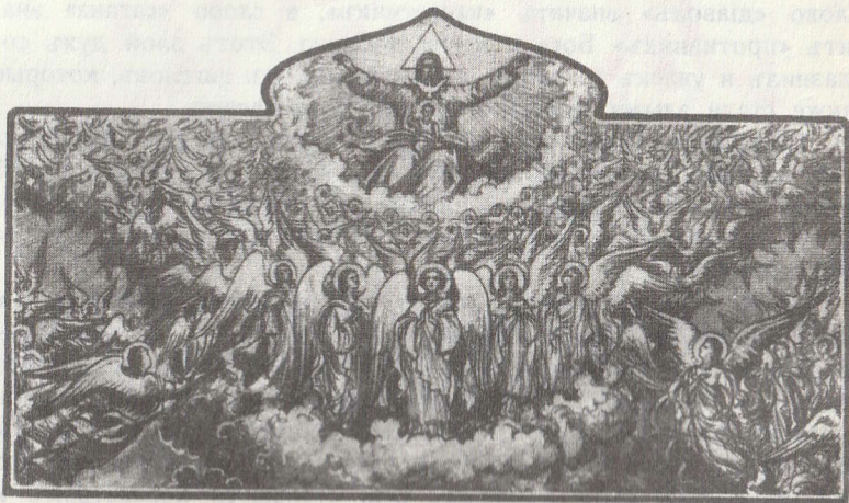
Сотвореніе неба — невидимаго міра.

«Въ началѣ сотворилъ Богъ небо и землю» (Быт. 1, 1).